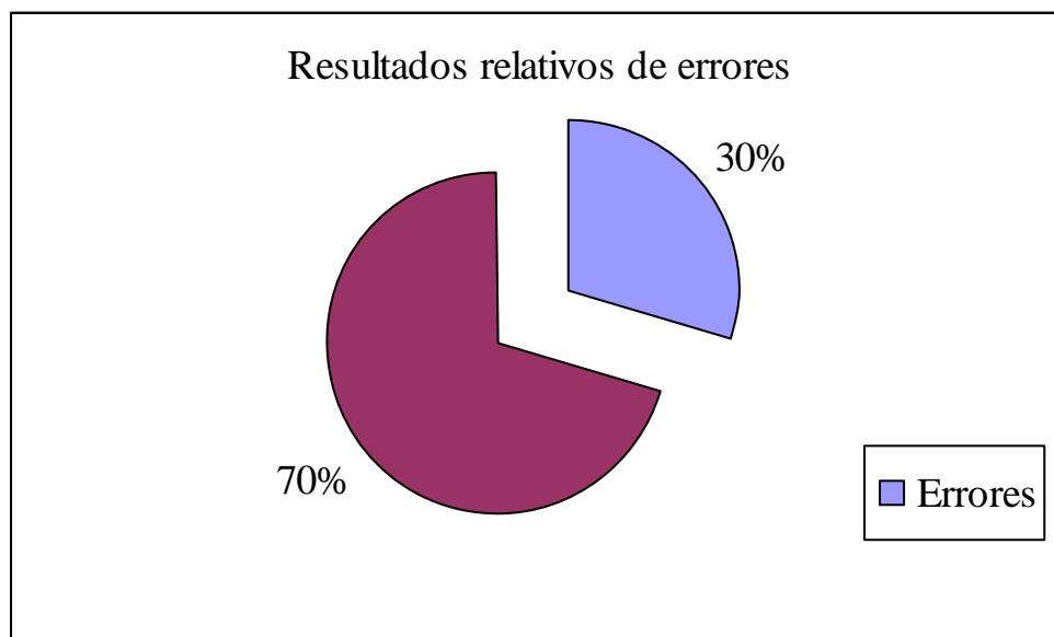
Figura N° 1 Porcentaje de errores en el corpus del estudio

Un porcentaje de fallas como el que se muestra en este estudio puede repercutir en el desarrollo lector del público infantil, asunto que debe tener su propio foco de atención para que se corrija en futuras traducciones del subgénero. Comenta Gillian Lathey ( The Role of Translators 149, loc. 3382) que los comités de los premios Batchelor Award y del Marsh Award , otorgados a las publicaciones de nuevos escritos para jóvenes traducidos al inglés, reconocen que la extranjerización no debería dar como resultado una falta de claridad en los textos, la cual muy probablemente frustra y aleja a los jóvenes lectores (Lathey 2010: 149 3382).